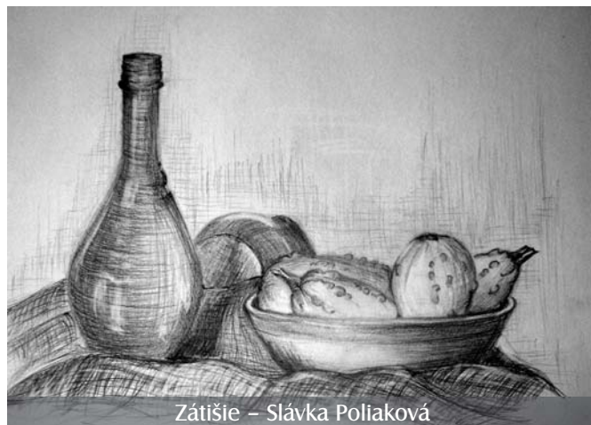
Zátišie – Slávka Poliaková