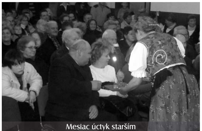
Mesiac úctyk starším