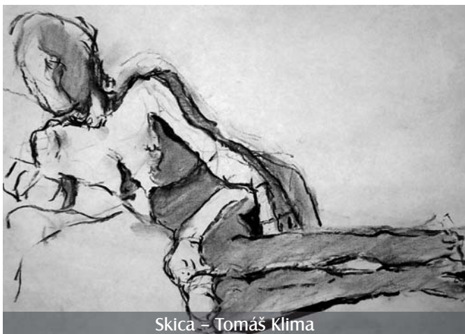
Skica – Tomáš Klíma