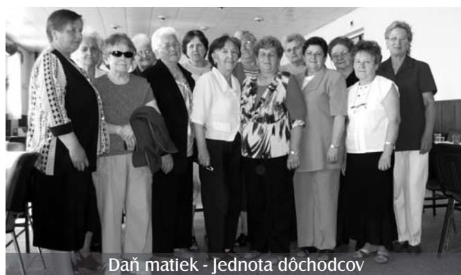
Daň matiek - Jednota dôchodcov