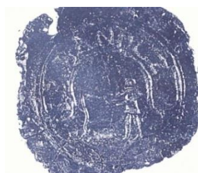
Obrázok 4 Pečať obce

Pečať obce Bánovce nad Ondavou tvorí nápis S.P.BANOC / čiže SIGILLUM PAGI BANOCZ =PEČAŤ OBCE. Podľa tejto pečate predstavuje symbol obce rybár s udicou stojaci na brehu rieky.