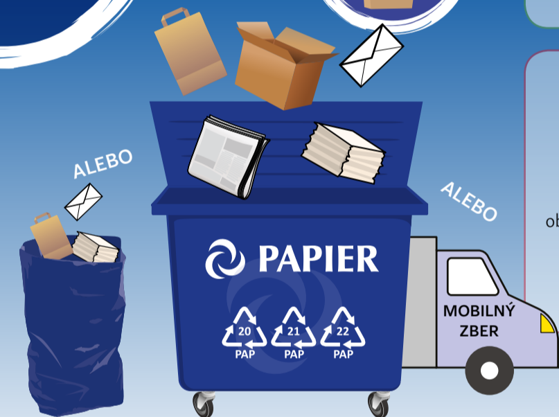
PODĽA SYSTÉMU ZBERU VO VAŠEJ OBCI