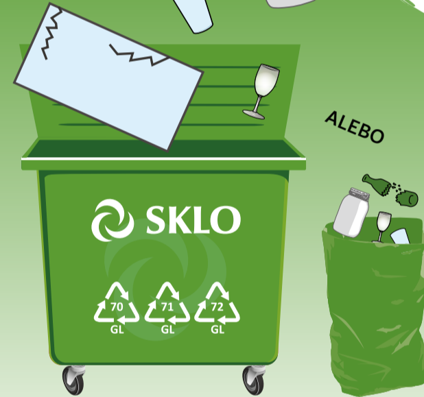
PODĽA SYSTÉMU ZBERU VO VAŠEJ OBCI

30 plastových fliaš sa zmení na fleecovú bundu?